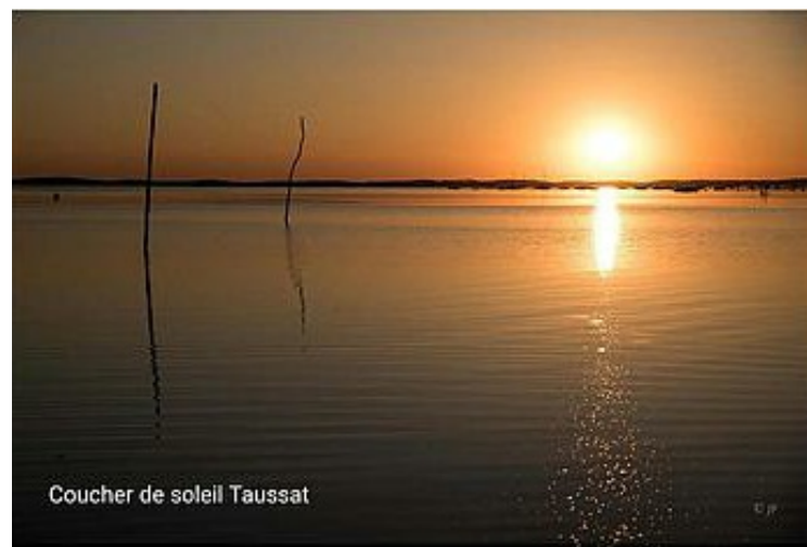
Coucher de soleil Taussat