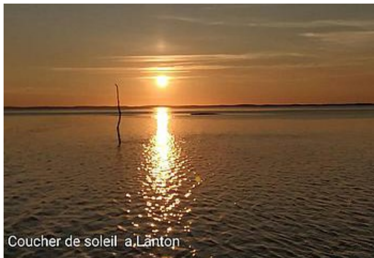
Coucher de soleil a.Lanton