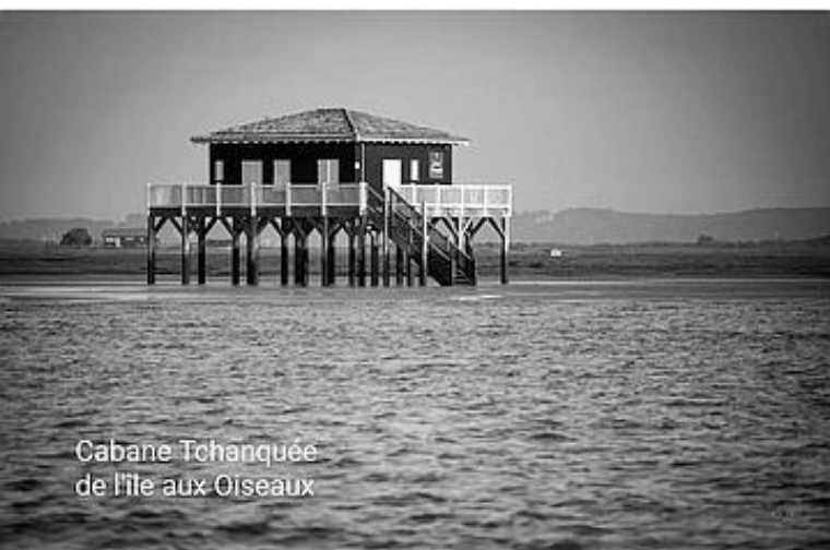
Cabane Tchanquée de l'île aux Oiseaux