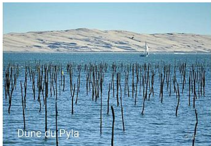
Dune du Pyla